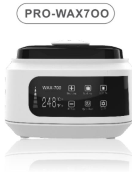
WAX HEATER operation instruction

Pouze pro profesionální použití Pro dosažení nejlepších výsledků si před použitím WAX MACHINE důkladně přečtěte všechny pokyny